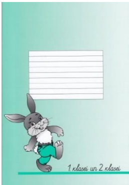
Līniju paraugs burtnīcām 1. semestrī