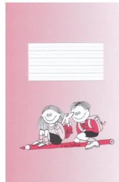
Līniju paraugs burtnīcām 2. semestrī